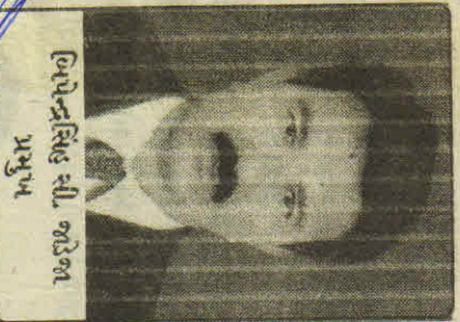
ડિપેન્ડેન્સિબલ સી. જીડીઆર પ્રમુખ